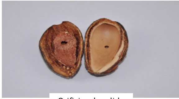
Orificios de salida